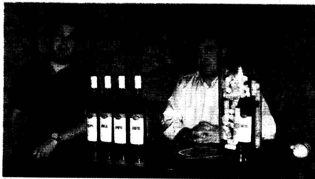
Adega de Lamego lança novo vinho

Um Lamecus premiado com a medalha de bronze no Wine Masters Challenge e o ouro no Concurso Mundial de Bruxelas, e que