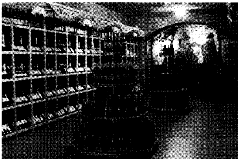
■ CAPELA DE VINHOS EM BORKÁPOLNA

sobre Portugal, do Instituto de Turismo. De destacar que os representantes da PONTI e da Delegação do ICEP, estiveram em directo na (Rádio Budapest)