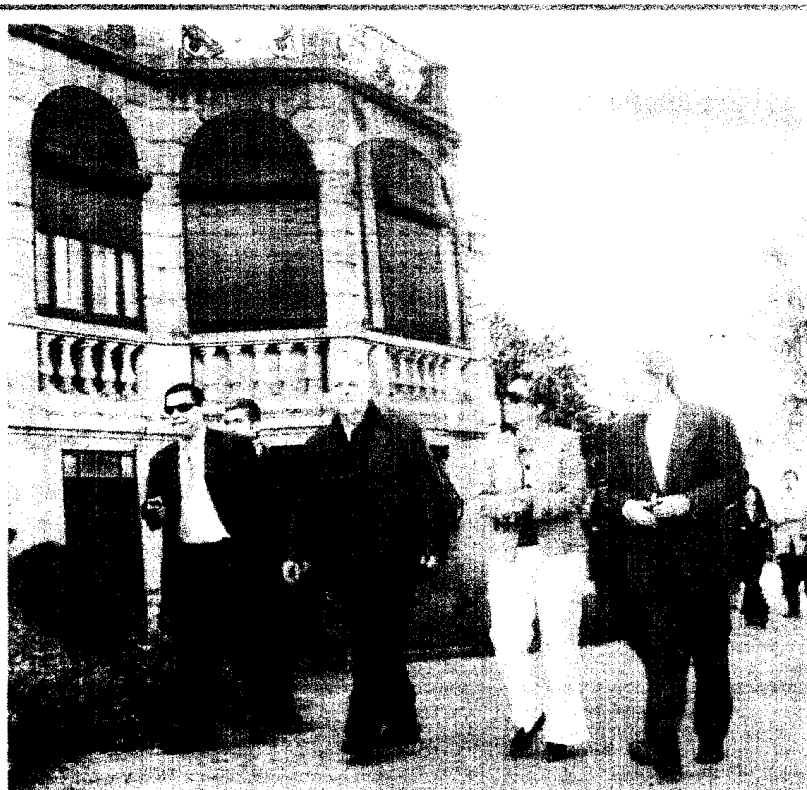
Ministra da Cultura visitou Gaia.