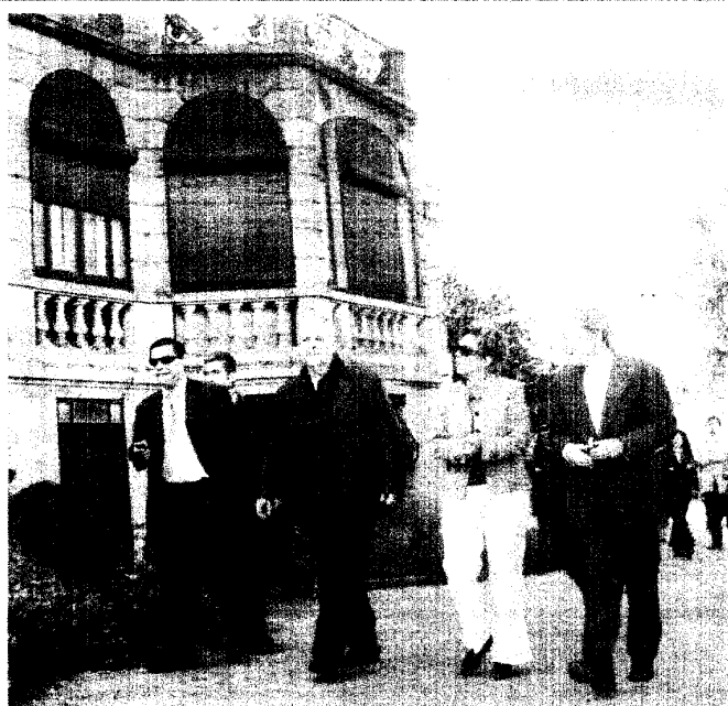
Ministra da Cultura visitou Gaia.