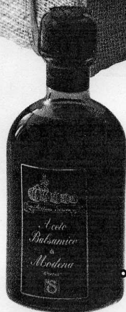
VINAGRE BALSÂMICO DE MODENA €16,80