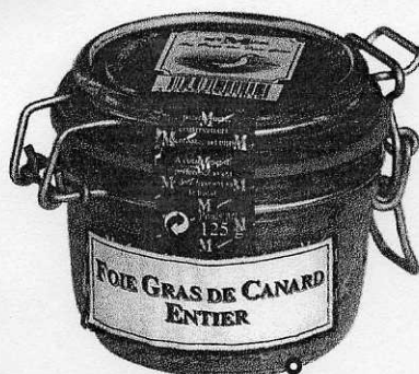
FOIE GRAS DE CANARD ENTIER DA MULLER €14,50