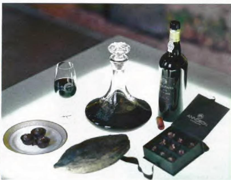
Em fevereiro, a pretexto do Dia dos Namorados, o My Port Wine Day abordará a ligação entre um porto – vintage ou late bottled vintage – da Ramos Pinto e as trufas de chocolate com malagueta da Annobon.