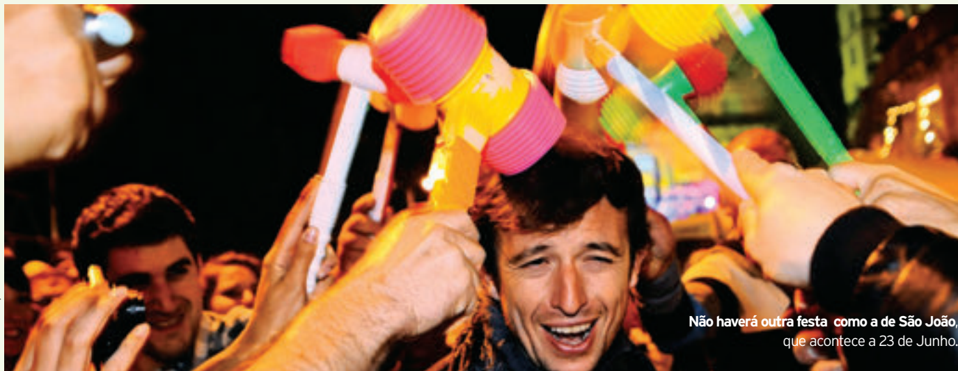
Não haverá outra festa como a de São João, que acontece a 23 de Junho.