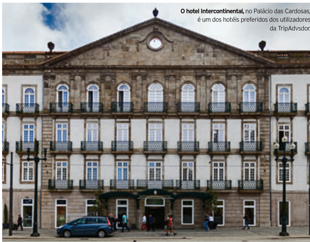
O hotel Intercontinental, no Palácio das Cardosas, é um dos hotéis preferidos dos utilizadores da TripAdvisor.

O maior clube de vinhos do mundo, Munsökanarna sueco, considera Porto e Douro como 'Wine Village of the Year' em 2012