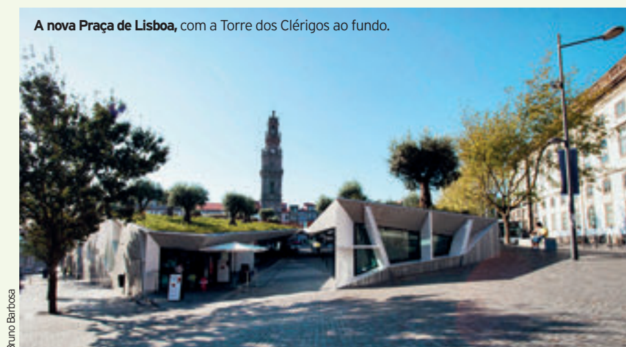
A nova Praça de Lisboa, com a Torre dos Clérigos ao fundo.

Um dos passeios mais conhecidos passa pelas seis pontes que ligam Porto a Vila Nova de Gaia: a Ponte D. Luís, a Ponte do Infante, a Ponte D. Maria Pia, a Ponte da Arrábida, a de São João e a Ponte do Freixo.