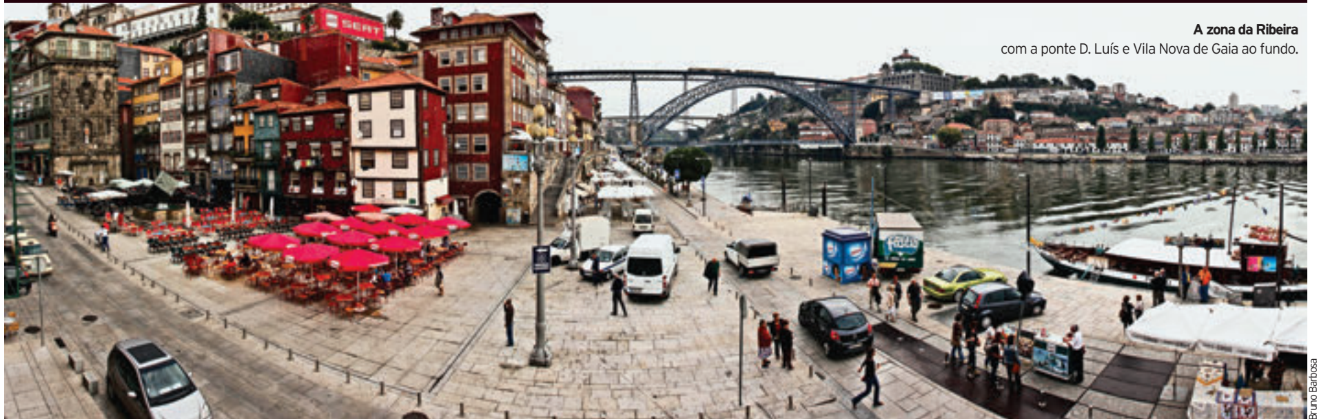
A zona da Ribeira com a ponte D. Luís e Vila Nova de Gaia ao fundo.