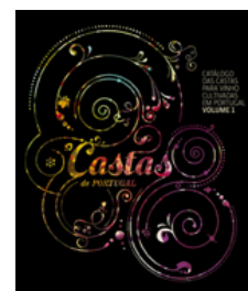
Cat3logo das Castas

OIV Organiza33o Internacional da Vinha e do Vinho