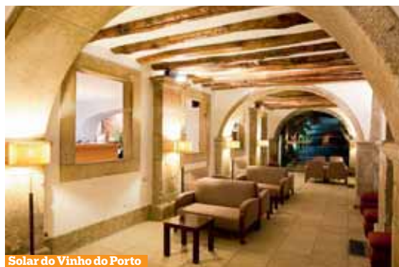
Solar do Vinho do Porto

No futuro ideal, haverá centros de informação nos oito municípios que constituem a rota. No entanto, este Espaço Bairrada continuará a ser o local-pivot de todo o projecto da associação. Quem sabe se terá então o wine bar , que está no projecto inicial.