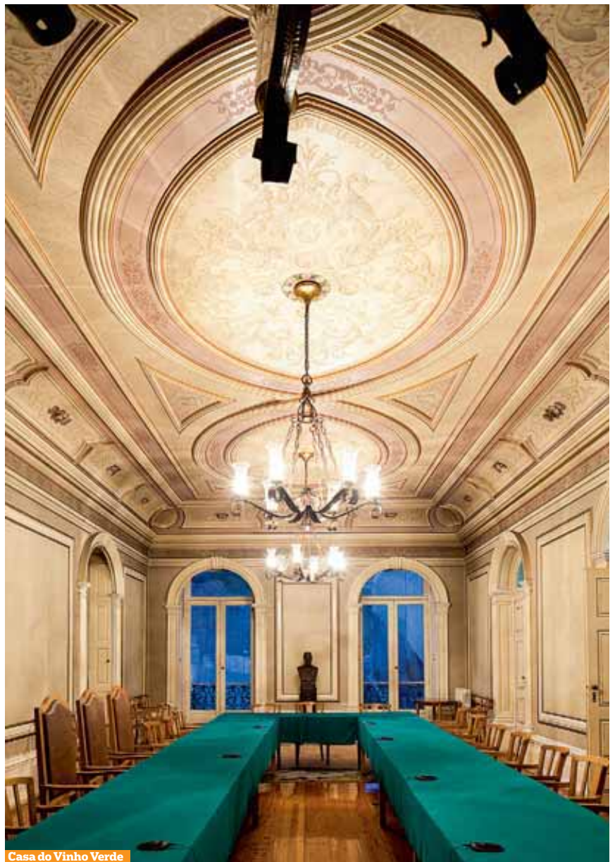
Casa do Vinho Verde