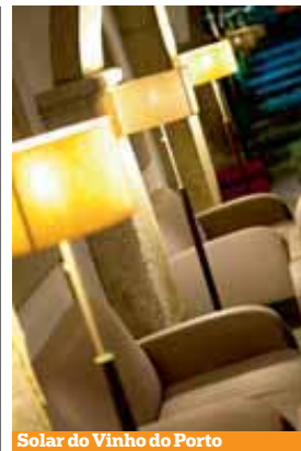
Solar do Vinho do Porto

No solar do Porto, estamos em pleno território oitocentista - na Quinta da Macieirinha, que alberga também o Museu do Romântico, tudo nas traseiras do Palácio de Cristal. No corpo principal do edifício, recria-se a atmosfera da alta burguesia portuense do século XIX e homenageia-se a memória do Rei Carlos Alberto do Piemonte, que aqui passou os últimos meses da sua vida no exílio; num andar inferior, com vista privilegiada para o rio, entramos em território do vinho do Porto. O ambiente é contemporâneo com traços tradicionais - há um certo charme discreto da burguesia bem contemporânea nos interiores de luzes suaves e um olhar à burguesia de antanho no jardim formal que é esplanada-miradouro a percorrer a paisagem desde as caves do Vinho do Porto em Gaia até ao mar, para lá da Ponte da Arrábida.