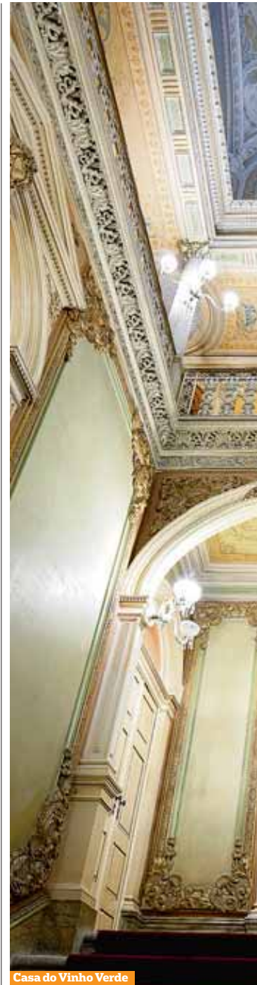
Casa do Vinho Verde

A passar por um período de reestruturação, a Casa - que não é solar porque “o nome é