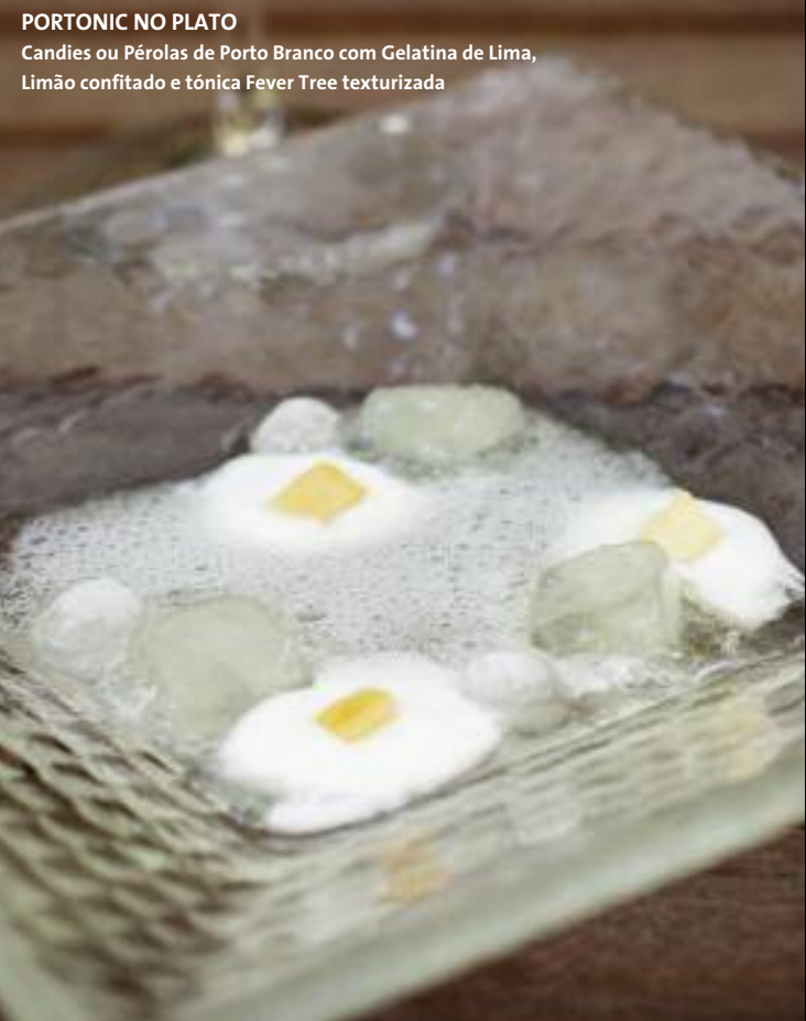
PORTONIC NO PLATO Candies ou Pérolas de Porto Branco com Gelatina de Lima, Limão confitado e tônica Fever Tree texturizada