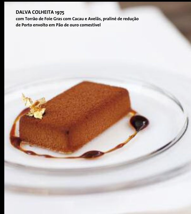
DALVA COLHEITA 1975 com Torrão de Foie Gras com Cacau e Avelãs, praliné de redução de Porto envolto em Pão de ouro comestível