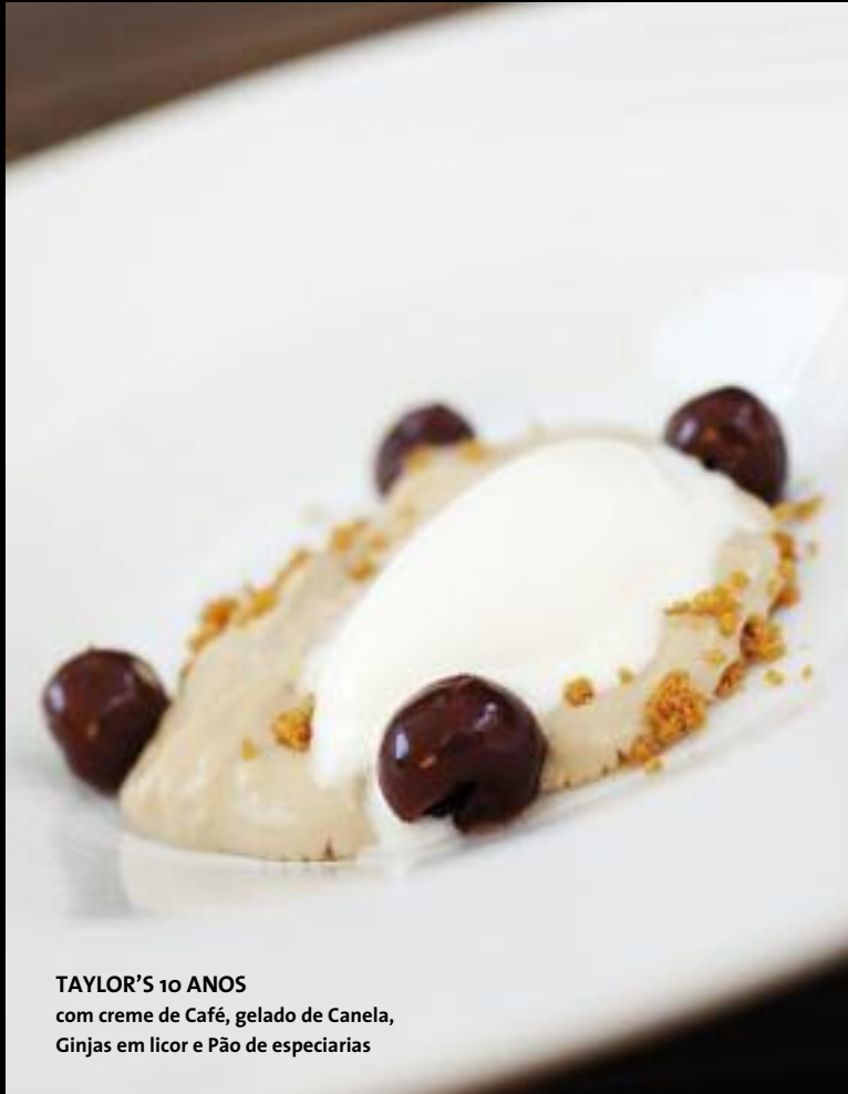
TAYLOR'S 10 ANOS com creme de Café, gelado de Canela, Ginjas em licor e Pão de especiarias