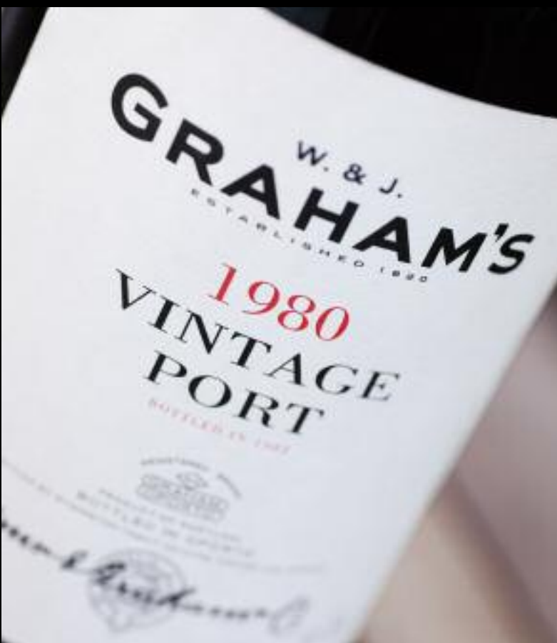
GRAHAMS VINTAGE 1980 com estufado de Cerejas de Terrades com gelado de Baunilha com Chá Preto, pó de Alcaçuz e esponjoso de Chocolate