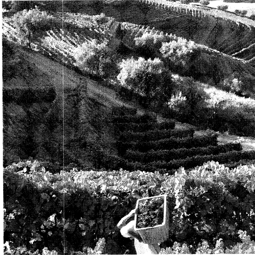
Qualidade das castas produzidas no Douro e nos vinhos verdes voltaram a ser premiadas nos EUA