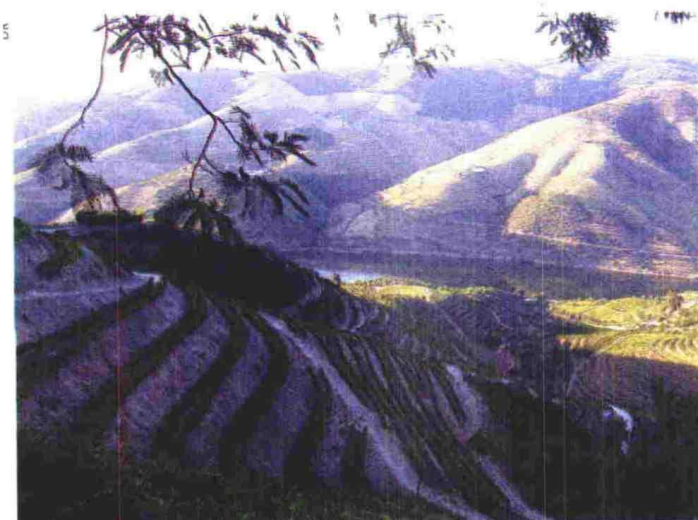
A Região Demarcada do Douro é conhecida pela produção de vinho do Porto reconhecido internacionalmente

Para comemorar o quinto aniversário, os "Douro Boys" vão lançar uma edição limitada de um vinho feito a partir da melhor barrica de cada quinta. Convidados especiais no evento são 15 jornalistas, portugueses e estrangeiros, a quem caberá a divulgação destes vinhos durienses. LUSA