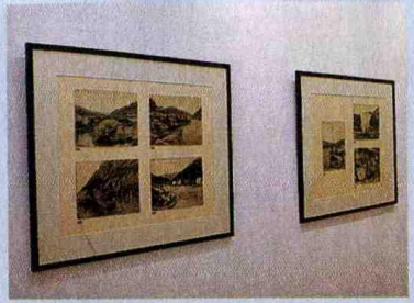
POSTAIS mostram o Douro vinhateiro