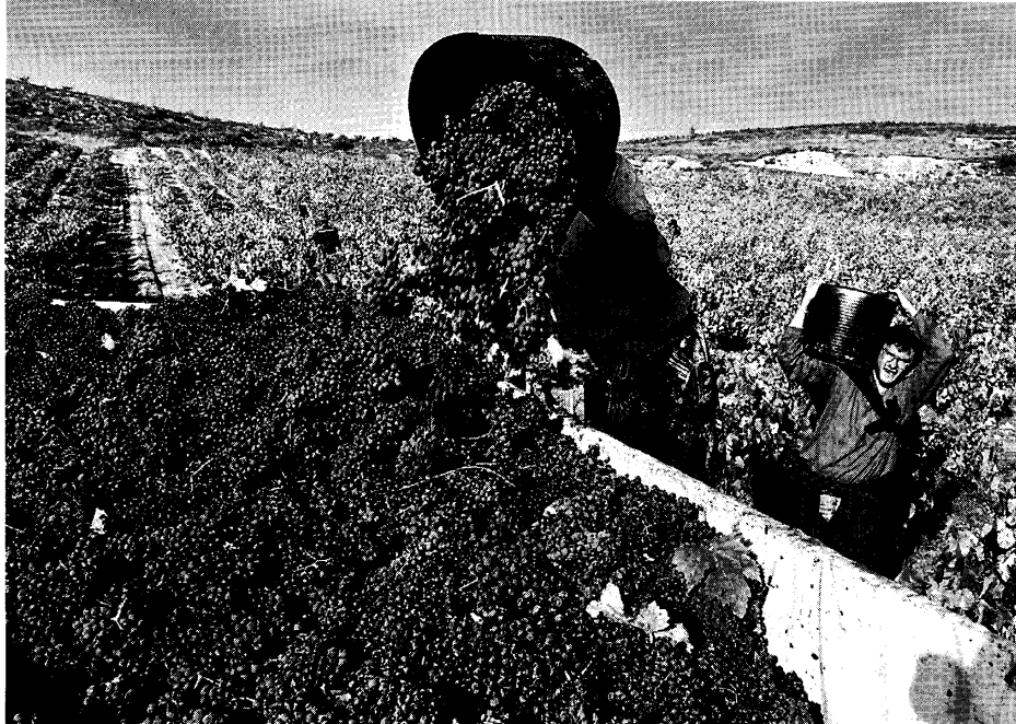
O Governo recia que os incentivos ao arranque da vinha afastem os viticultores mais pobres da actividade