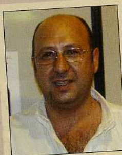
Joel Baptista Adega Coop. Benfica do Ribatejo

As oportunidades que apareceram no ano passado não me satisfizeram por completo, decidimos então voltar.