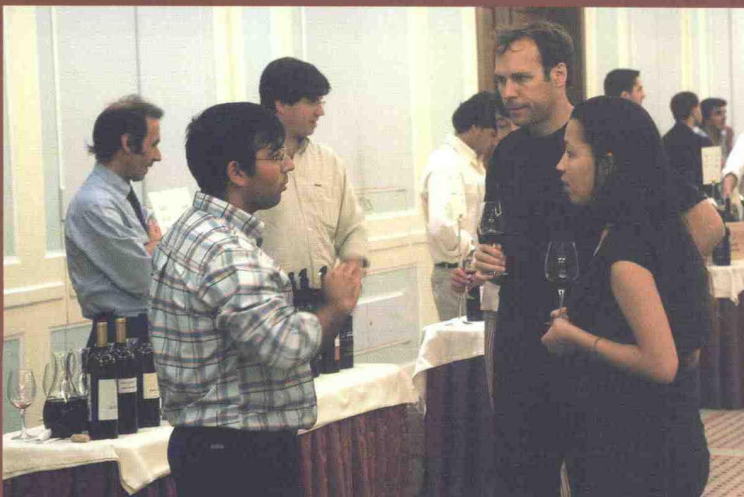
Prova Final foi também um ponto de encontro de apreciadores de vinho.