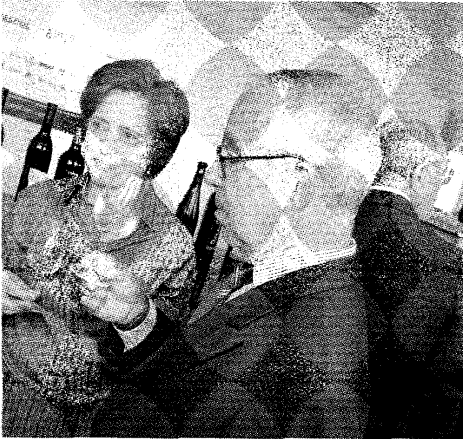
A prova de vinhos no Camarote Vip do Estádio Cidade de Coimbra

Alguns dos aromas seleccionados podem ainda ser saboreados na zona de exposição de vinhos da Feira Comercial e Industrial de Coimbra, patente no Estádio Cidade de Coimbra até ao próximo domingo.