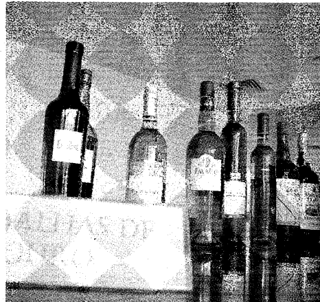
16 vinhos receberam a medalha de ouro