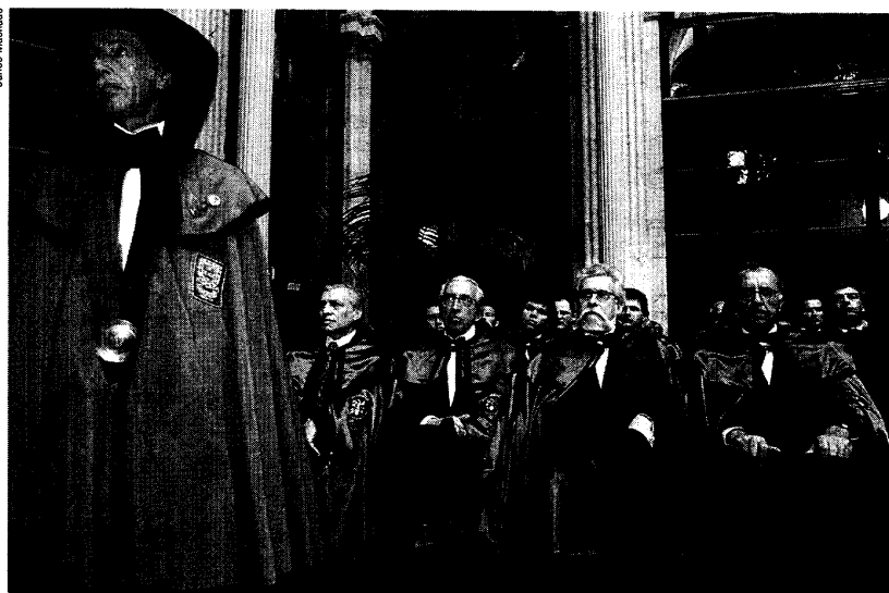
Os confrades prometem honrar, defender e divulgar o vinho do Porto