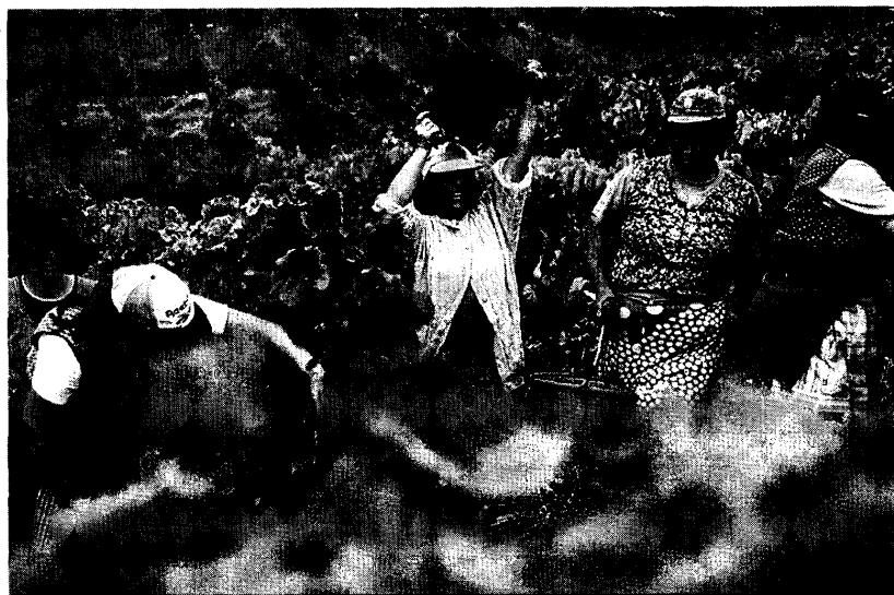
Em algumas zonas do Douro a produção foi afectada em cerca de 90 por cento