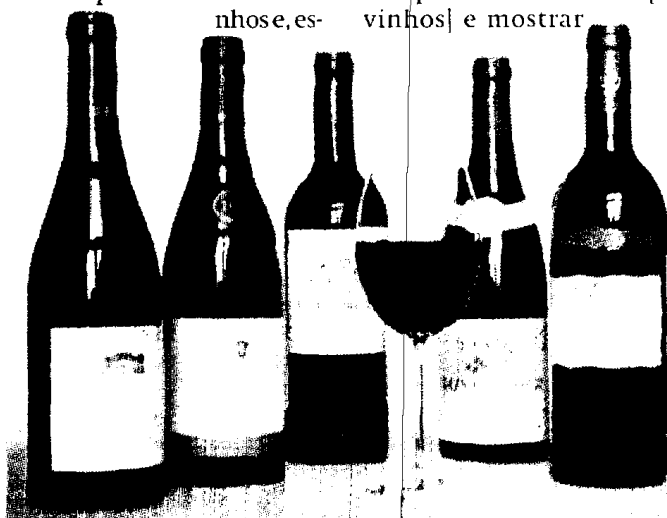
VÁRIAS categorias de vinho vão ser apreciadas na Exponor.

Os eventos pretendem divulgar e promover dentro e fora de portas as empresas portuguesas, bem como fortalecer as relações comerciais entre os profissionais do sector vitivinícola. METRO