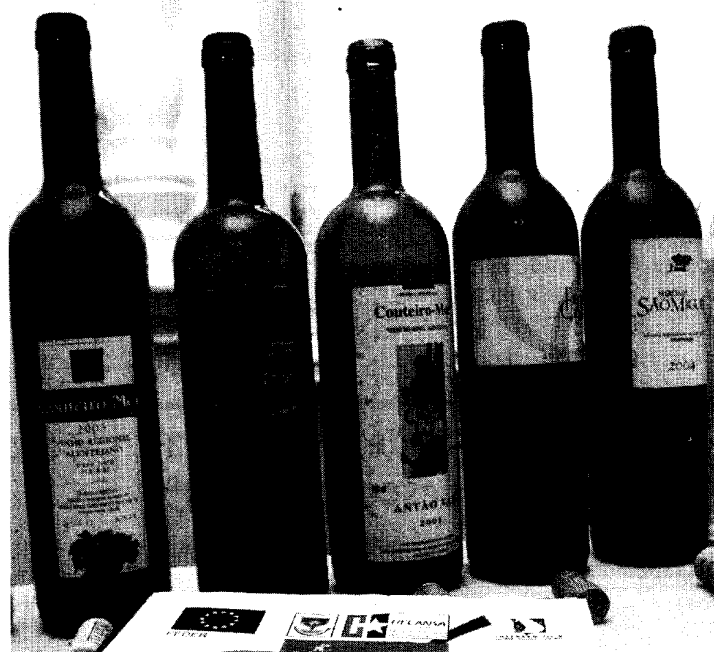
Hotel do Colégio promove nova prova de vinhos